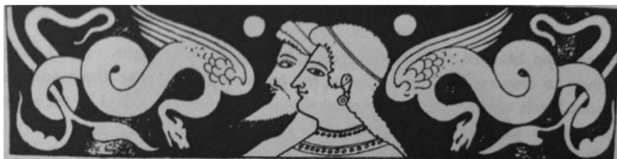
► Illustration tirée de Etruscan Magic and Occult Remedies de Charles Leland, 1895.

Apprenez les règles élaborées par l'expérience acquise des anciens.